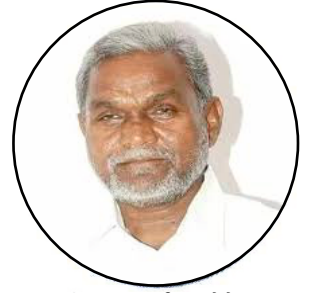
श्री चंपई सोरेन